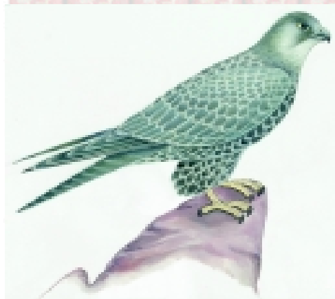
السنقر أو السنجاري (السلالة الداكنة)

وتوجد طيور السلالة الداكنة في الجزء الجنوبي من نطاق انتشاره الطبيعي في أقصى الشمال -جرينلاندا وإيسلندا. ويكون لون الصقر البالغ فيها رمادياً بنياً مخططاً تخطيطاً منتشراً غير محدد وعليه ترقيط بعلامات داكنة و فاتحة اللون، ويوجد بياض على منطقة الجبهة. البقعة حول العين داكنة مسودة، وكذلك خط الشارب. السطح السفلي أبيض لكنه مغطى بنقاط كثيفة على الصدر وخطوط عريضة على الكفين والبطن. ويظهر على السطح السفلي للجناحين علامات واضحة على الكواسي، معظمها شاحب اللون. وهناك بقعة بيضاء لبنية تمتد بعرض قواعد ريش القوادم. والتخطيط على السطح السفلي للذيل غير واضح.