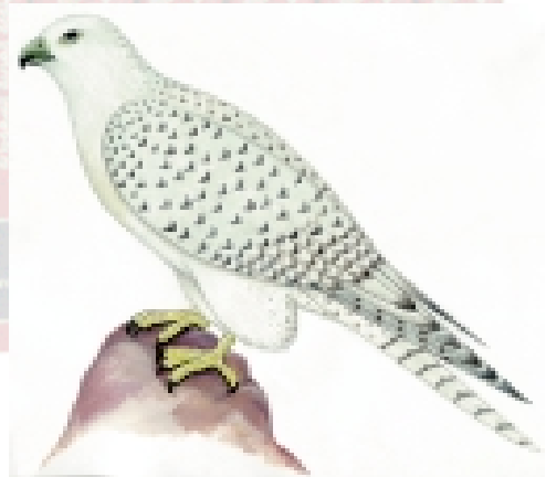
السنقر أو السنجاري (السلالة البيضاء)

مواطنه وهجرته. ويوجد الصقر السنقر (السنجاري) عند دوائر العرض الشمالية الباردة في المناطق القطبية وتحت القطبية، فوق حدود انتهاء منطقة نمو